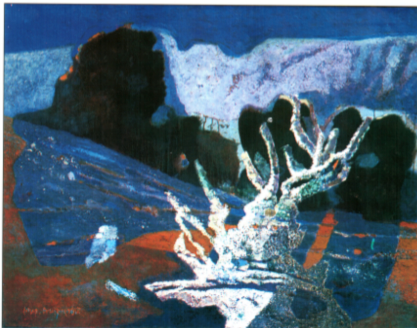
Babi zub, ulje na platnu, 80x100 cm (2001)

Ово што овде видимо је обиље нијансе плаве боје, обиље призора, обиље нових ствари које вам пролазе кроз главу док медитирате. Чудесни ђавољи лик на небу се појављује, уједно страشان али и помало смешан. Уметник је врага замислио са шиљатим вучјим ушима, очима различите боје и једним црвеним оштрим зубом.