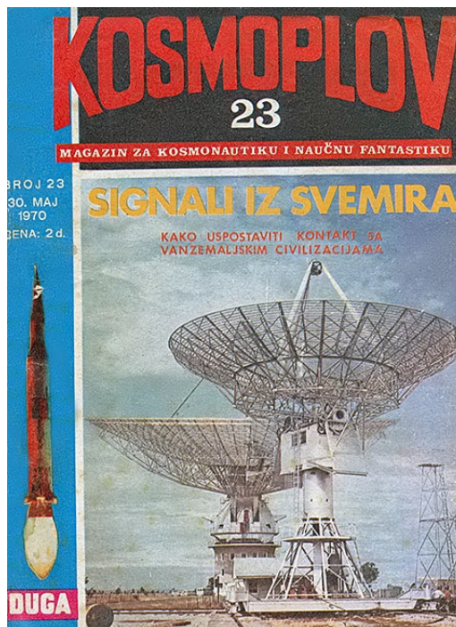
Слика 1: Насловна страна једног броја „Космоплова“.