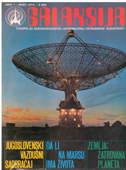
Слика 2: Овако је изгледао први број – представљен је као часопис за ваздухопловство,астронаутику и истраживање будућности.