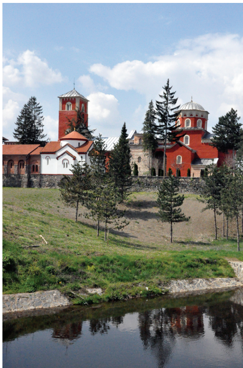
Слика 2. Манастир Жича.

става о важности и суделовању тренутка у процесу уметничко визуелног бележења.