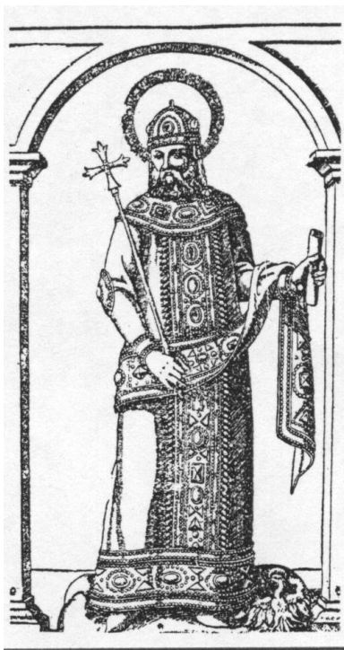
Слика 1. Цар Андроник II Палеолог.

Године 1320. Теодор Метохит је претставио свог сјајног ученика Андронику II Палеологу (1282-1328), који је, захваљујући својој вештини и интелигенцији задобио царско поверење.