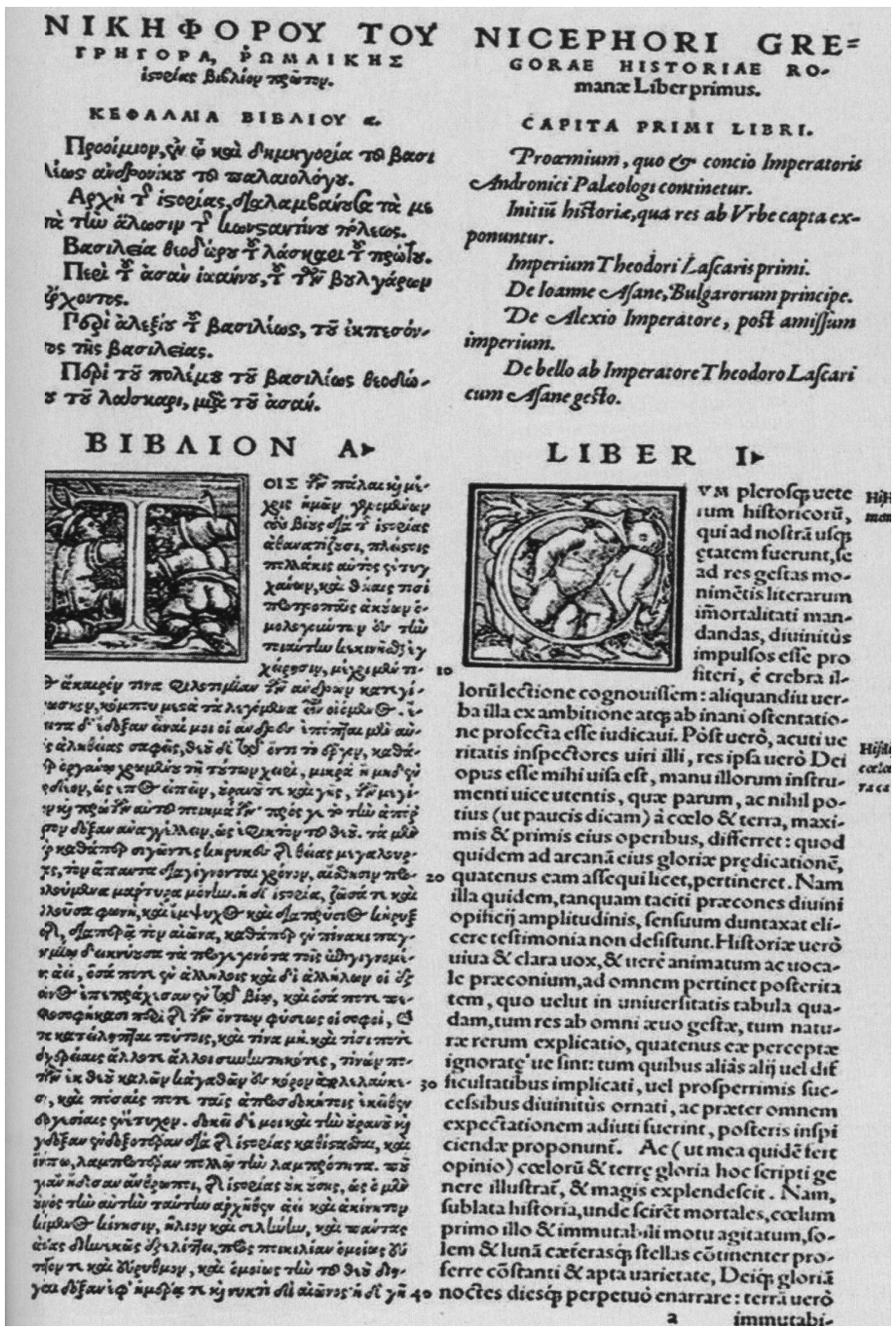
Слика 7. Двојезични (грчки и латински) текст Историје Византије Нићифора Григоре у библиотеци у Базелу.