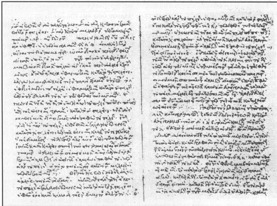
Слика 3. Из Ватиканског кодекса (Codex Vaticanus) група 318 лист 146п-147г: Нићифор Григора Како направити астролоб .

Касније, после абдикације његовог заштитника Андроника другог 1328. године, Григора је пао у немилост, изгубио имање и повукао се из јавног живота. Патријарх Константинопоља Исаија (1323-1332) поставља 1330. године Григору, како због говорничке вештине тако и због теолошког знања, на чело делегације Православне цркве, послате да учествује у дијалогу о уједињењу са Католичком. Григора се суочио са делегатима папе Јована XXII (1316-1334) не уступајући ни стопу пред њиховим захтевима за папски примат.