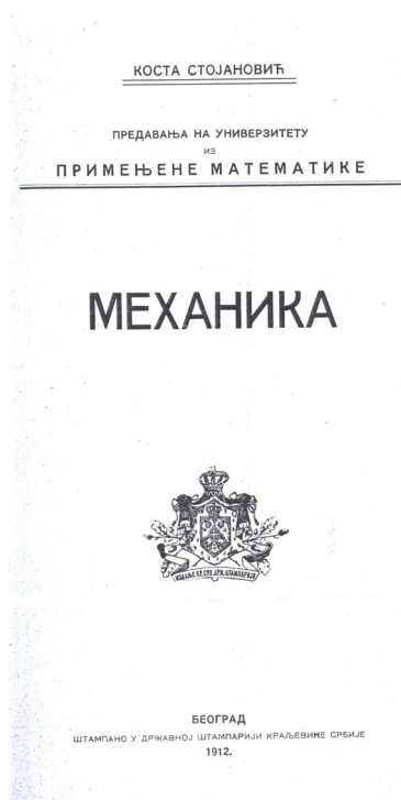
Слика 2. Насловна страна Стојановићеве Механике из 1912. године.