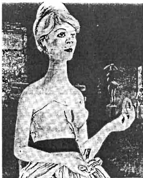
■ Милан Поповић: Драга из УЛУС-ове галерије.

Слика 3. Милан Поповић: Драга из УЛУС-ове галерије. Из Књиге Милића од Мачве (1987).